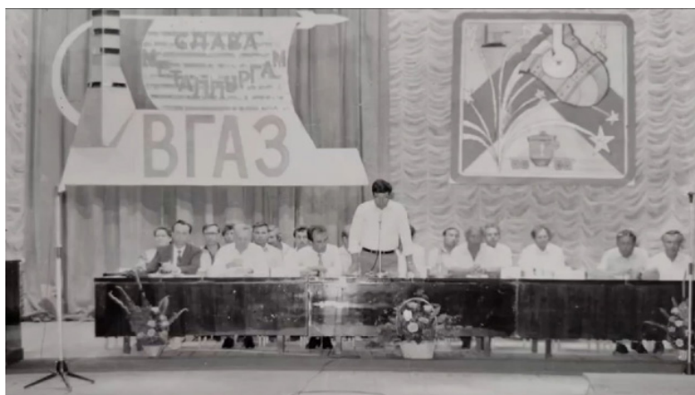
Рис. 4. Мероприятие во Дворце культуры алюминиевого завода в 1970-е гг. [Там же]

На фотографии (рис. 3) запечатлен Дворец культуры алюминиевого завода примерно в 1970–1980-е гг. На здании наблюдаются элементы сталинского ампира: обилие декора, колонны и прямоугольный фасад здания. На фотографии, которая представлена на официальном сайте Дворца культуры, запечатлено одно из мероприятий (рис. 4). Анализ фотокарточки позволяет отметить, что это мероприятие посвящено металлургам, перед столами стоят цветочные композиции, а на фоне сделаны огромные плакаты – это все свидетельствует о торжественности мероприятия.