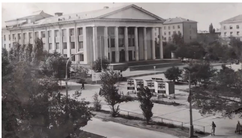
Рис. 3. Дворец культуры алюминиевого завода 1970-е гг. [8]

19 декабря 1970 г. свои двери открыл Дворец культуры Волгоградского алюминиевого завода в Тракторозаводском районе города. Данный Дворец культуры был построен с учетом вышеуказанной специфики исследуемого периода – организации досуга рабочих промышленных предприятий.