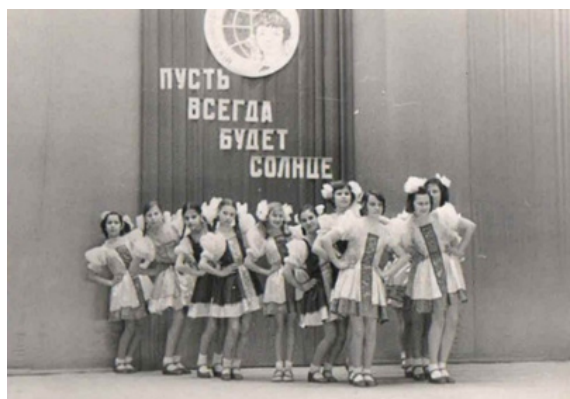
Рис. 7. Детский танцевальный коллектив «Радость», 1980-е гг. [1]