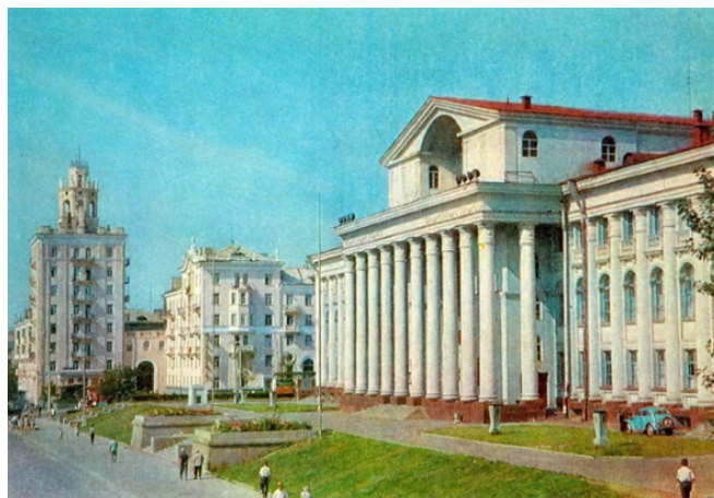
Рис. 1. Дворец культуры «Красный октябрь» 1966–1967 гг. [10]

На фотокарточках (рис. 1, рис. 2) запечатлён Дворец культуры во второй половине 1960-х гг.