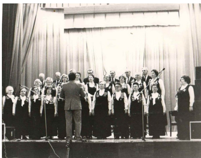
Рис. 9. Хор ветеранов войны, 1980-е годы [Там же]

Также при ДК был организован известный во всем городе хор ветеранов войны (рис. 9).