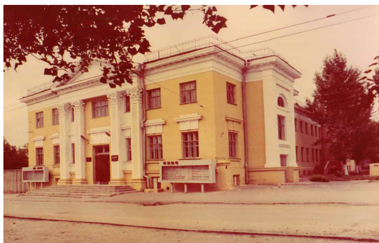
Рис. 6. Дом культуры Волгоградского трамвайно-троллейбусного управления (1970–1980-е гг.) [Там же]

В 1957 г. был полностью восстановлен разрушенный в период Великой Отечественной войны Дом культуры при Волгоградском трамвайно-троллейбусном управлении (ВТТУ) [1]. Он был предназначен не только для работников ВТТУ, их семей, но и для всех жителей Ворошиловского района.