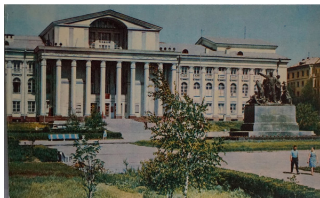
Рис. 2. Дворец культуры металлургов им. В.И. Ленина 1969 г. [11]

Грაციозные античные колонны, прямоугольный фасад здания и лепнина в качестве элемента декора колонн сразу привлекают взгляд. Архитектурный стиль сразу ясен – сталинский ампи́р. Здание выгля-