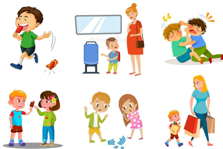
Рис. 2. Игра «Какой это поступок?»

2. «Какой это поступок?». Задача: ребенку необходимо разделить поступки по цветам: в белую корзинку – хорошие поступки; в черную – плохие.