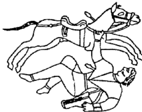
Рис. 2. Упавший всадник на круглодонном сосуде из погребения у Косики (Енотаевский район Астраханской области) [Там же, с. 181]