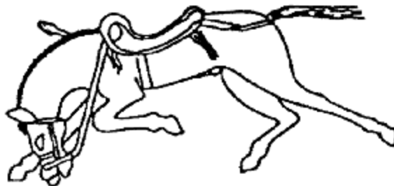
Рис. 3. Лошадь раненная в холку на круглодонном сосуде из погребения у Косики (Енотаевский район Астраханской области) [Там же, с. 183]