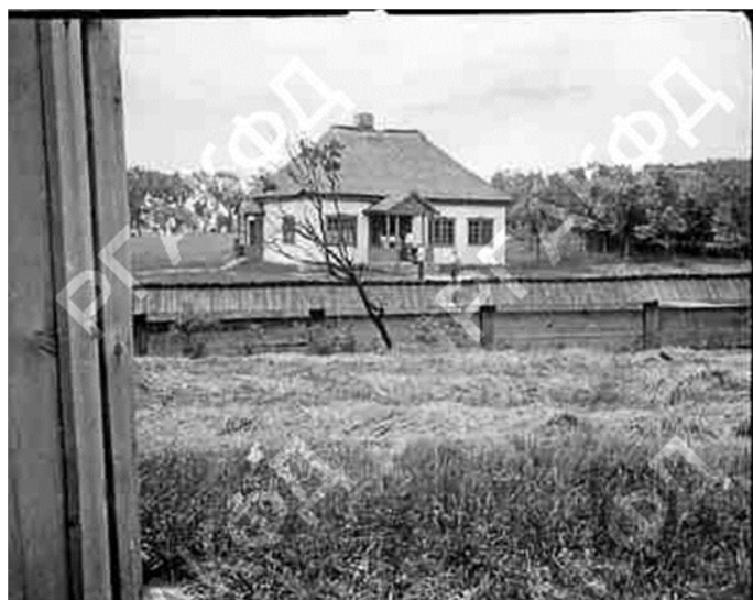
Рис. 1. Кузнецов В. Общий вид здания церковно-епархиальной школы из села Ломашово [12]

Период царствования Александра III характеризуется процессом свертывания предоставленной ранее автономии учреждениям среднего и высшего образования. Принятый в 1887 г. циркуляр о «кухаркиных детях» ограничил принцип все доступности и все сословности обучения в гимназиях. Дети простолюдинов перестали получать образование. Начальная же школа полностью стала контролироваться Святейшим Синодом. Университетский устав 1884 г. окончательно отменял университетскую автономию. Выросшая цена на образование также отсекала от учебы многих молодых людей. Однако полностью приостановить процесс образования и вернуться к дореформенному строю не представлялось возможным из-за качественного толчка вперед общественного сознания. Свидетельством этого становится сохранение практически всего комплекса строений, предназначенных под образование всех уровней: здание церковно-епархиальной школы из села Ломашово (см. рис. 1).