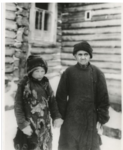
Рис. 6. Булла К. Голод на Волге. Дед и внука [2]

Контрастным в данной связи является положение привилегированных слоев общества в 1881–1894 гг. Однако, обратим внимание на портрет княгини Зинаиды Николаевны Юсуповой с сыном Николаем в парке (см. рис. 7). Несмотря на экономические и культурные различия между работающим народом и привилегированным обществом, от страшной болезни не был застрахован никто. Княгиня пострижена налысо после лечения от тифа. Этот факт свидетельствует о наличии запустения активно развивающейся до этого периода медицины.