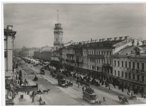
Рис. 2. Ностиц И. Вид Невского проспекта у Гостиного двора [14]

Вид Невского проспекта у Гостиного двора (см. рис. 2) свидетельствует о неуклонном росте транспортных связей в городах и между регионами.