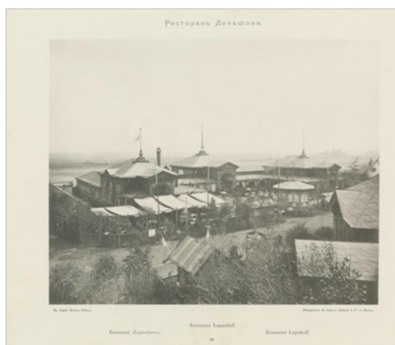
Рис. 4. Шерер, Набгольд и К° Ресторан Лопашова [21]