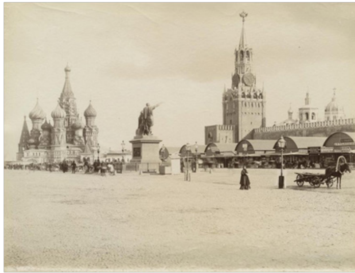
Рис. 10. Шерер, Набгольц и К о Торговля на Красной площади [22]