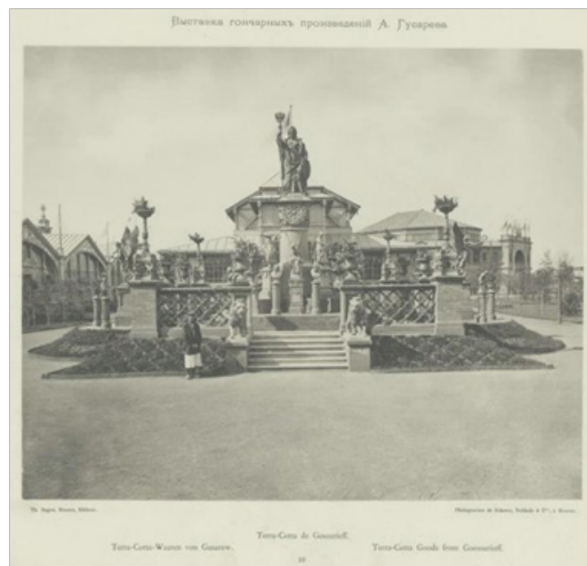
Рис. 11. Шерер, Набгольц и К о Выставка гончарных произведений А. Гусарева [20]

На всероссийской художественно-промышленной выставке, которая проходила в 1882 г. на Ходынском поле в Москве, вся Россия, даже самые отдаленные местности представили образцы своих творений. Выставка дала явные доказательства, что Россия во многом смело может соперничать с зарубежными продуктами, а некоторыми произведениями превышает даже зарубежные (см. рис. 11).