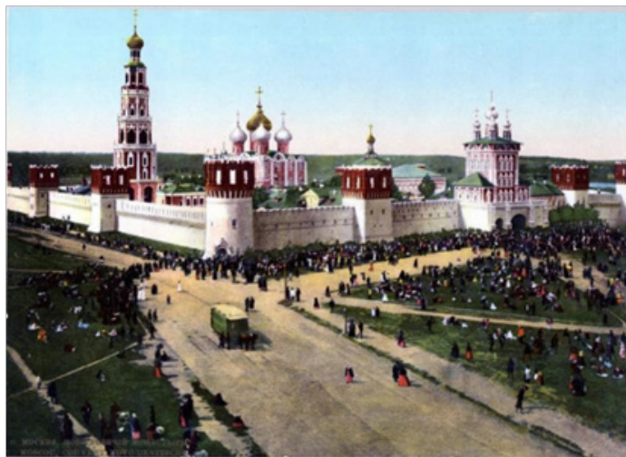
Рис. 8. Павлов П. Новодевичий монастырь. Крестный ход [15]

Крестный ход около Новодевичьего монастыря (см. рис. 8) и подъем креста на Спасо-Преображенскую церковь (см. рис. 9) свидетельствуют о широчайшем распространении Русской Православной церкви в регионах, где к концу XIX в. большинство населения еще были старообрядцами.