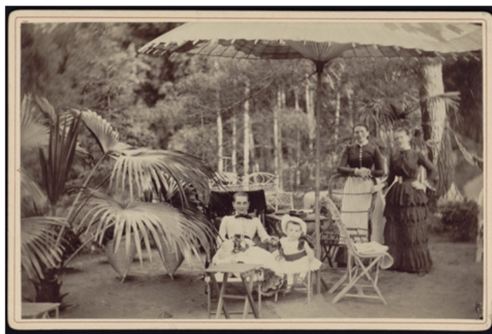
Рис. 7. Дьяговченко И. Княгиня Зинаида Николаевна Юсупова с сыном Николаем [8]

Контрастным в данной связи является положение привилегированных слоев общества в 1881–1894 гг. Однако, обратим внимание на портрет княгини Зинаиды Николаевны Юсуповой с сыном Николаем в парке (см. рис. 7). Несмотря на экономические и культурные различия между работающим народом и привилегированным обществом, от страшной болезни не был застрахован никто. Княгиня пострижена налысо после лечения от тифа. Этот факт свидетельствует о наличии запустения активно развивающейся до этого периода медицины.