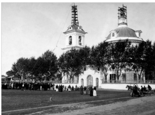
Рис. 9. Подъем креста на Спасо-Преображенскую церковь [16]

Наряду с внедрением духовных и культурных образцов, необратимо продолжался процесс капитализации России и внедрения экономических связей во все сферы жизни общества (см. рис. 10 на с. 122).