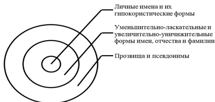
Рис. 1. Структура антропонимического поля

Ученые делят развитие русской антропонимии на следующие периоды [2, с. 90]: