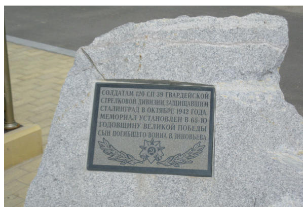
с. Стрельноширокое.  (2011 г.)