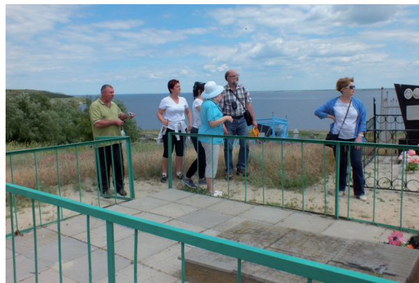
ст. Суводская. Фото О. Прозоровой (Красновой) (2016 г.)