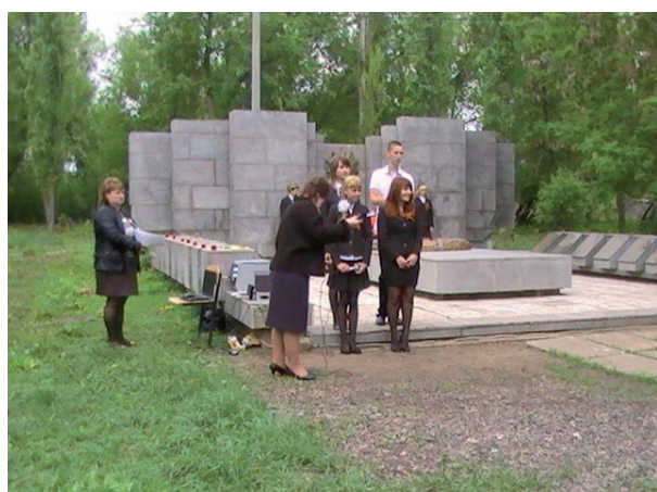
с. Оленье. (2015 г.)