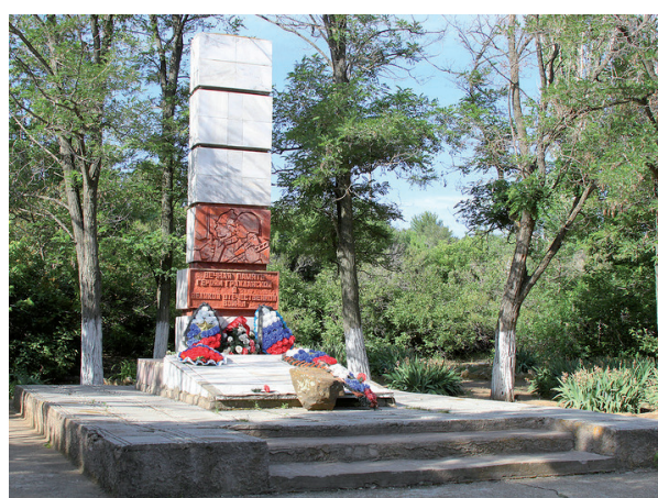
с. Песковатка. [1]