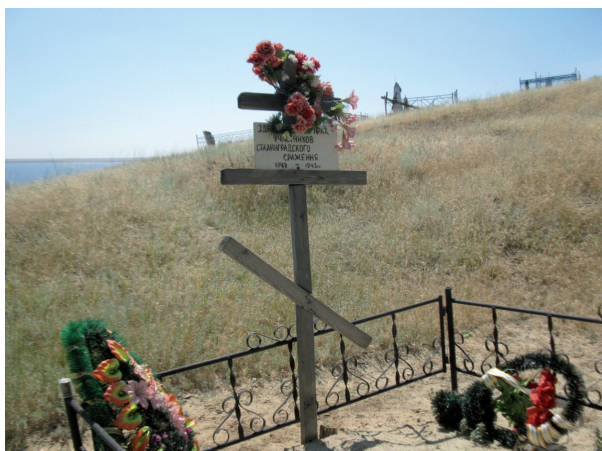
ст. Суводская. (2011 г.)