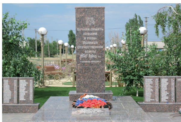
с. Стрельноширокое. Фото автора (2011 г.)