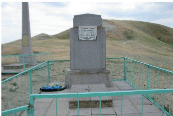
ст. Суводская. (2011 г.)

Исключение, к сожалению, составляет станица Суводская. За братской могилой давно нет ухода. Неподалеку от нее недавно появился деревянный крест на невысоком холмике, который, вероятно, поставили родственники похороненных в братской могиле на ее настоящем месте периода 1942–43 гг.